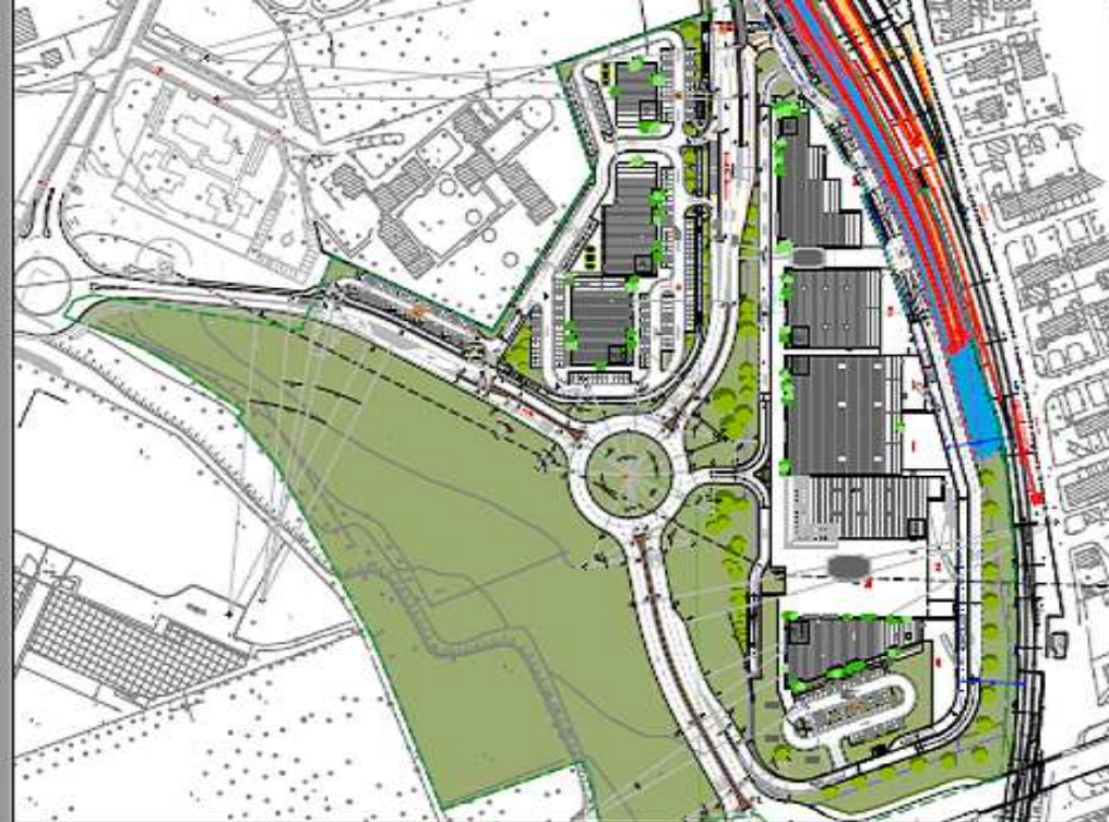
PLANimetria generale 1:1000