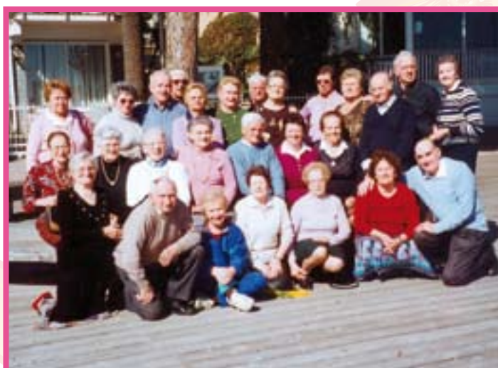
Sempre attivi e...in salute i nostri anziani, qui ritratti nel soggiorno al mare in Liguria nell'inverno scorso...

Consolidamento nella gestione e promozione dei bandi emessi dall'Azienda Consortile Isola Bergamasca sia per l'erogazione di buoni sociali per le persone che si occupano della cura dell'anziano e per le famiglie che hanno assunto una badante per la cura dei loro cari sia per l'erogazione di voucher per l'inserimento al Centro Diurno Integrato. Nel corso del 2010 si è mantenuta l'organizzazione delle vacanze invernali degli anziani presso località marittime (San Bartolomeo al mare - Imperia). Vengono confermate e mantenute le attività culturali nell'ambito dell'Università della Terza Età (Anteas, T.U.); il servizio di trasporto per le cure termali e l'attivazione di corsi di ginnastica e yoga per la terza età.