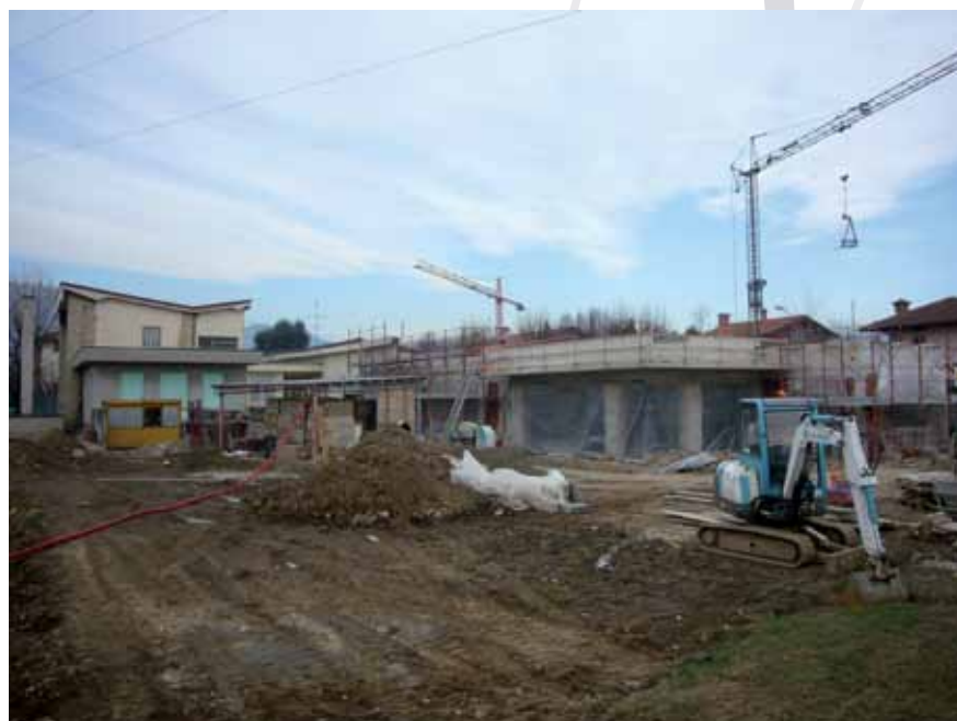
Ampliamento scuola materna a Locate

Un doveroso ringraziamento all'Associazione Genitori, al Comitato Genitori ed ai componenti delle varie Commissioni (Mensa, Trasporto) e dei Tavoli (Diritto allo studio, Scuola) per la preziosa attività di supporto e di complemento all'intera attività scolastica. Un grazie a tutti coloro che assicurano l'assistenza sul bus, l'assistenza in mensa ed ai vari servizi tanto sentiti ed apprezzati dalle famiglie. Auguriamo al nuovo dirigente, docenti, personale, genitori, famiglie ed alunni un anno scolastico sereno e ricco di esito e soddisfazioni. Auspichiamo rapporti costruttivi e proficui, convinti che operando in sinergia tra Scuola ed Ente Locale, ciascuna Istituzione possa facilitare il lavoro dell'altra e quindi rispondere in maniera più efficace e qualificante alle esigenze reciproche, nell'interesse dell'utenza.