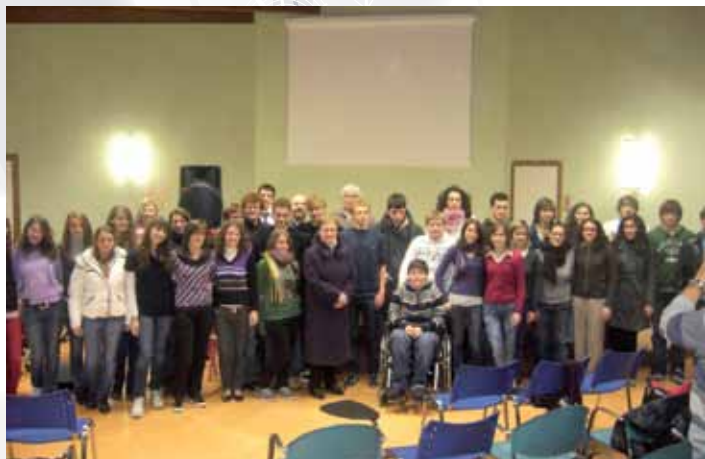
Aperitivo Intelligente con Lode 2009

Lo staff del CAG Atelier augura a tutti Buone Feste!