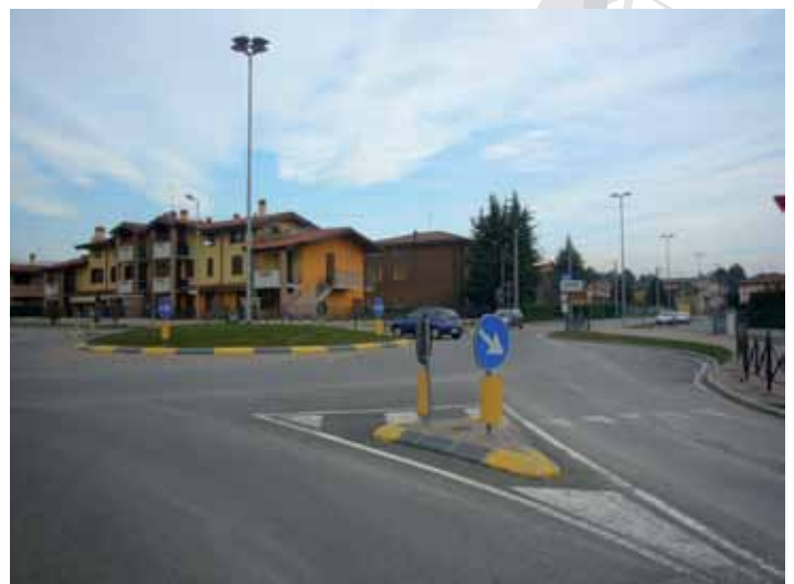
Nuova rotonda a Locate, intersezione tra le vie: Gerolamo Mapelli - via N. Barre - via Lazzarini