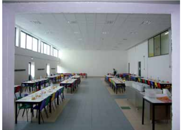
Nuova mensa scolastica presso edificio scuola media via Piave

- Per arredi e attrezzature scolastiche negli ultimi 4 anni scolastici sono stati spesi 43.470 euro.