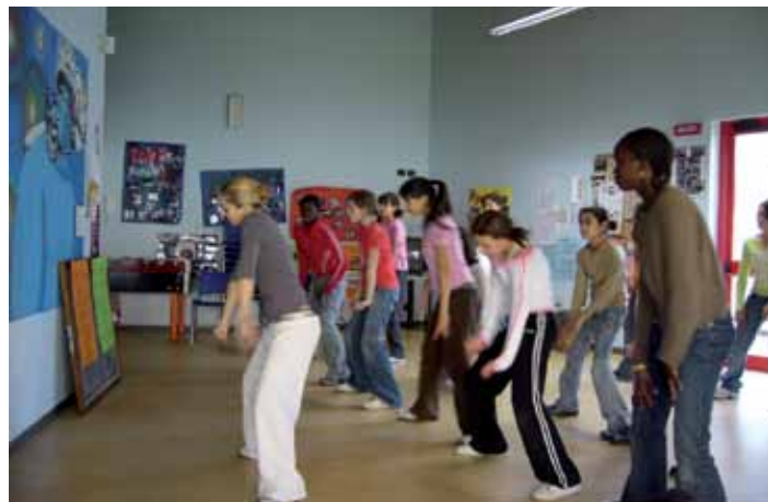
Corso di ballo Hip-Hop 2007