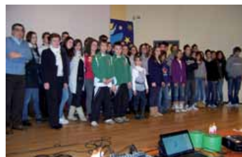
Foto di gruppo con i premiati per meriti sportivi, culturali, scolastici.

I nominativi degli studenti meritevoli premiati venerdì 17 dicembre 2010 sono così divisi: