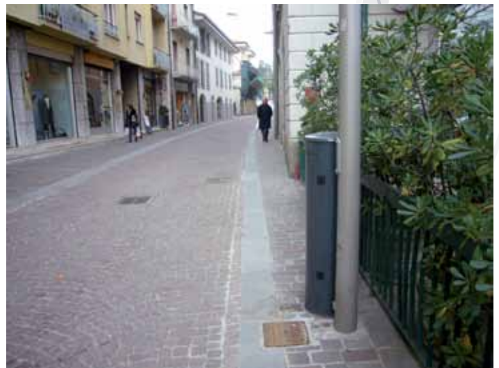
Marciapiedi di via Garibaldi (rifacimento cordoli pavimentazione in pietra e nuove colonnette elettriche per distribuzione lungo la via Garibaldi)

Per un ambiente più sano l'amministrazione ha sottoscritto un accordo di programma con la società pubblica HYDROGEST che nei prossimi mesi realizzerà una serie di pompe e tubazioni atte a convogliare liquami che convergono nel Brembo verso la fognatura principale e quindi al depuratore.