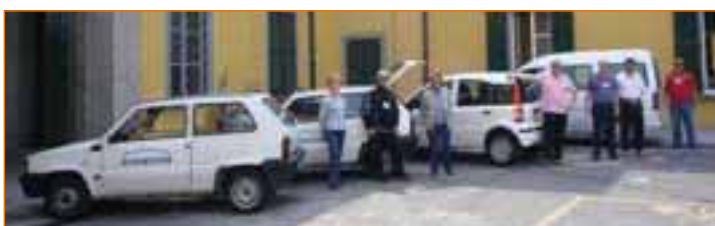
La nuova Eco Panda in forza al Servizio Sociale... sempre più mobili e vicini a chi ha bisogno. Grazie ai volontari dell'ANTEAS ed al prezioso supporto di lavoratori socialmente utili.

- progetti di sollievo e di integrazione socio-occupazionale