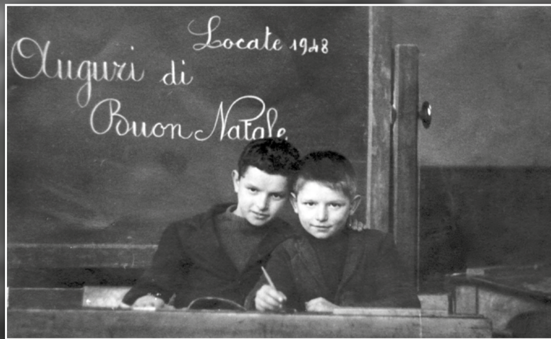
Due scolari di Locate ci augurano Buon Natale!