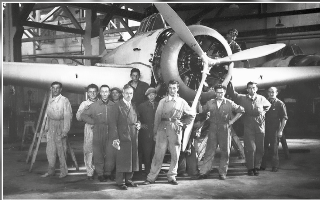
Tecnici e maestranze della C.A.B., Cantieri Aeronautici Bergamaschi, posano davanti ad un aereo nel secondo dopoguerra.