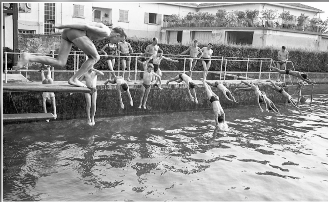
Ragazzi si tuffano in un bacino di riserva dell'acqua proveniente dal fiume Brembo in caso di incendi, adattato a piscina dalla Legler.

LABORATORIO DI FALEGNAMERIA ATTREZZATO PER REALIZZARE OGNI GENERE DI MOBILE SU MISURA