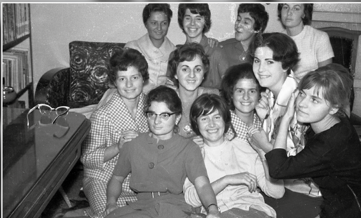
Gioioso gruppo di coscritte del 1940 di Ponte San Pietro.