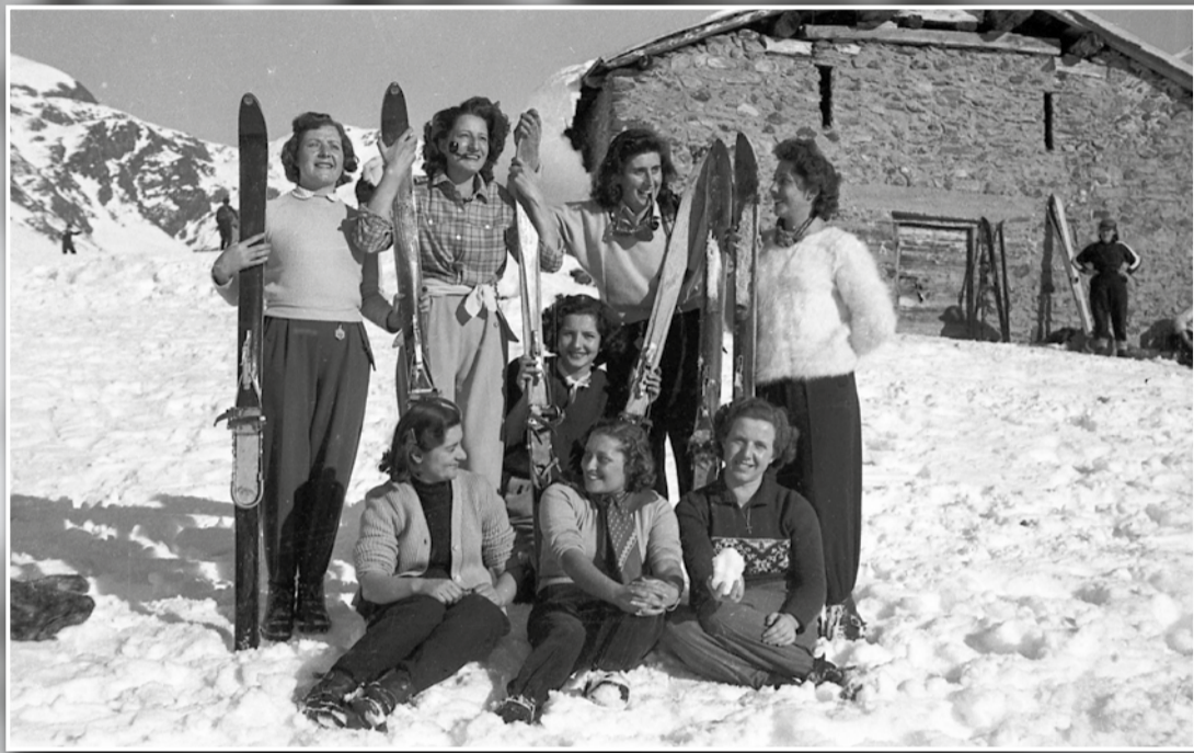
Allegre ragazze in gita sciistica, con il CAI, posano tra la neve davanti ad una baita: a quei tempi lo sci non era uno sport per tutti.