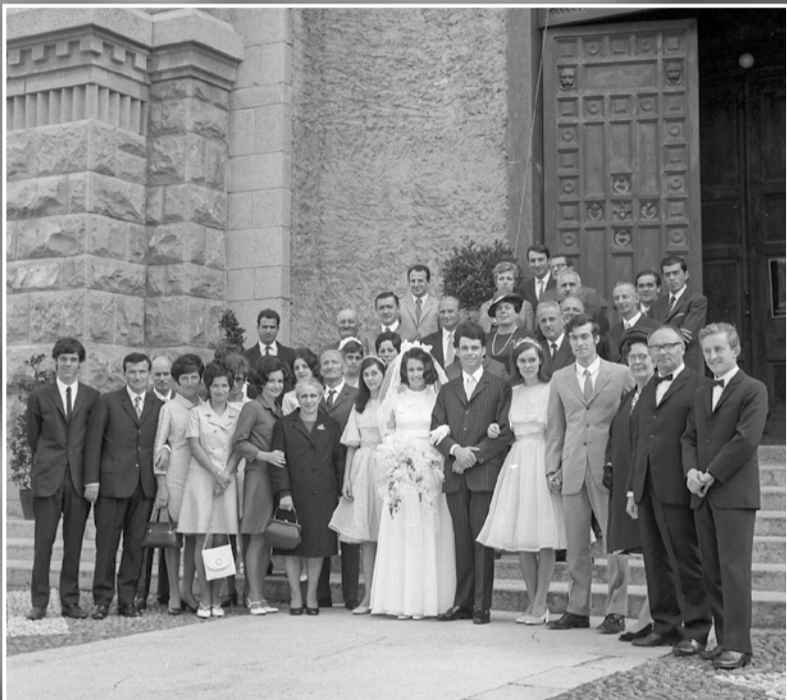
Dopo la cerimonia matrimoniale all'interno della Chiesa Nuova, è tradizione la foto di gruppo sul sagrato con gli sposi attornati dagli invitati.